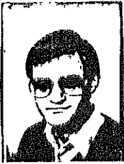
*De Knuddeloog (archieffoto)