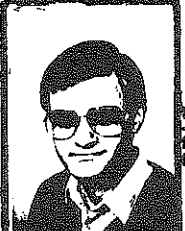
*waardeloos een blad